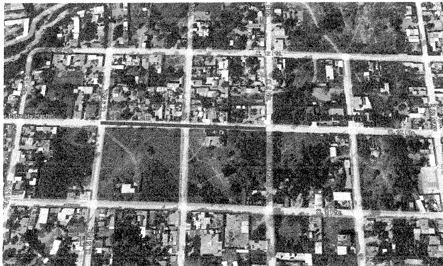
Imagen 1. Localización del sitio en donde se ejecutará el proyecto

Una vez realizada la ubicación del sitio del proyecto, se determinó que la zona donde se localiza corresponde a ZAP urbana.